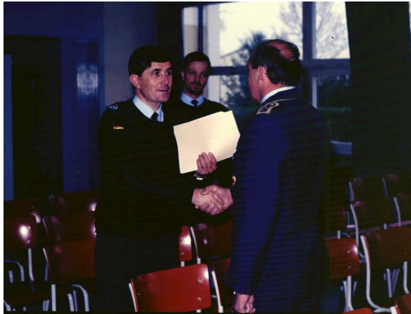
18. Juli Btl-Sportfest