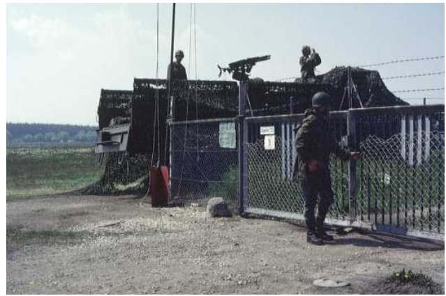
25. Juni Btl- und Rgt-TacEval Personalbesichtigung