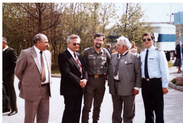
BM Reimer BM Rauchenecker